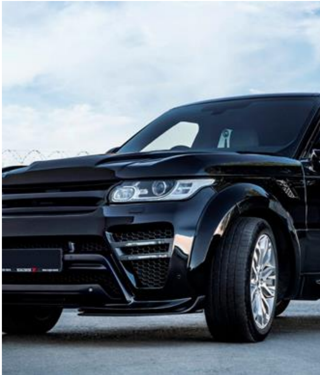
RRS, 2014 год Год выпуска: 2014 Объём двигателя: 3.0 л Мощность двигателя: 306 л. с. Коробка передач: автомат Привод: полный