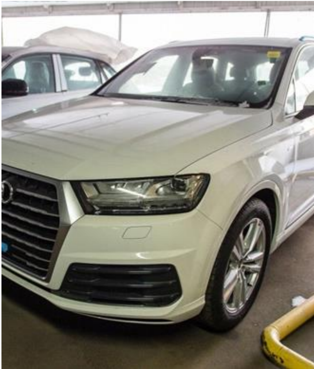
Audi Q7, 2018 год Год выпуска: 2018 (Новый) Объём двигателя: 3.0 л Мощность двигателя: 333 л. с. Коробка передач: автомат Привод: полный