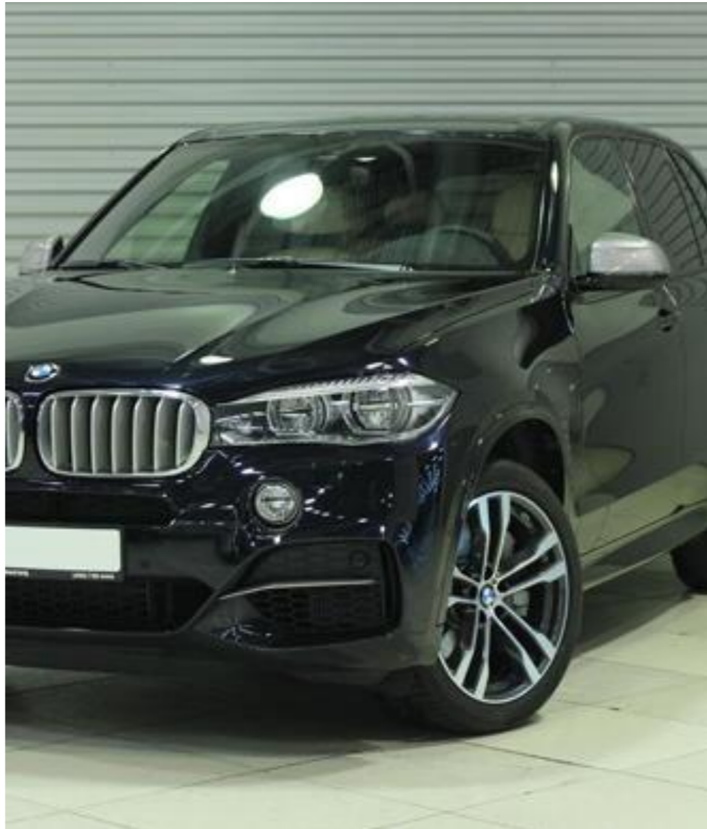
BMW X5, 2018 год Год выпуска: 2018 (Новый) Объём двигателя: 3.0 л Мощность двигателя: 249 л. с. Коробка передач: автомат Привод: полный