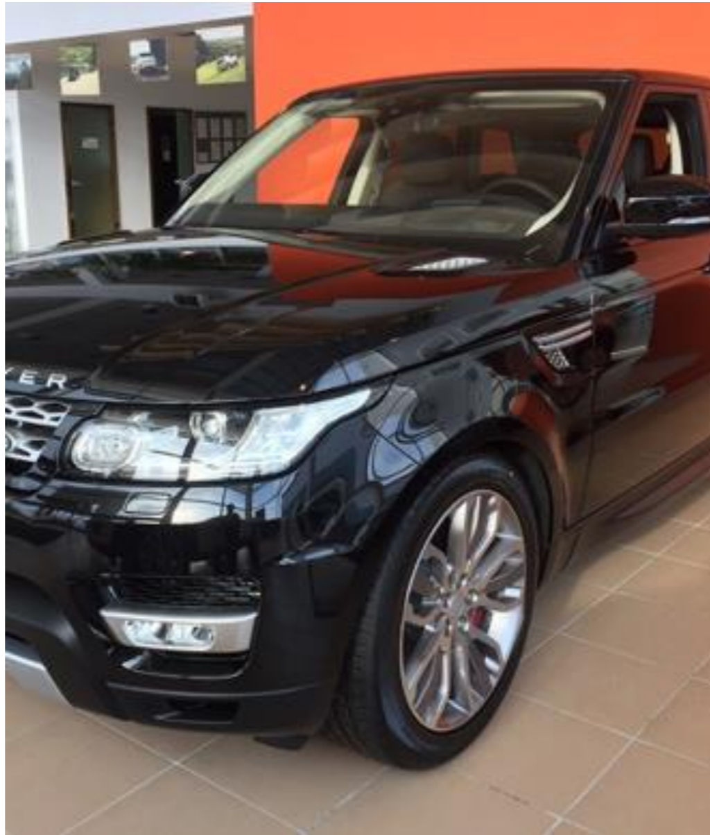
RRS, 2018 год Год выпуска: 2018 (Новый) Объём двигателя: 3.0 л Мощность двигателя: 306 л. с. Коробка передач: автомат Привод: полный