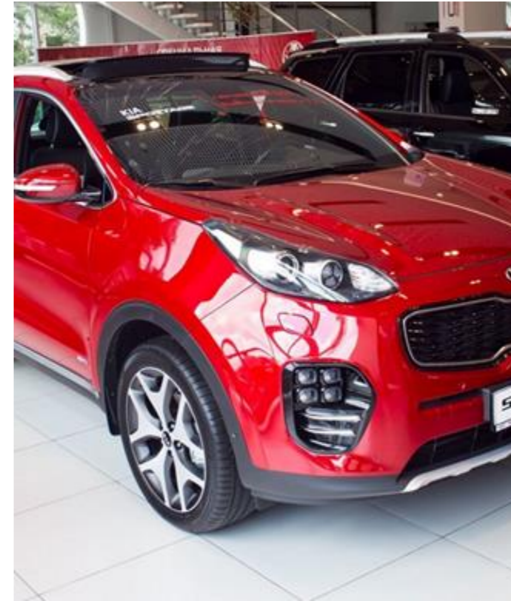
KIA Sportage, 2017 год