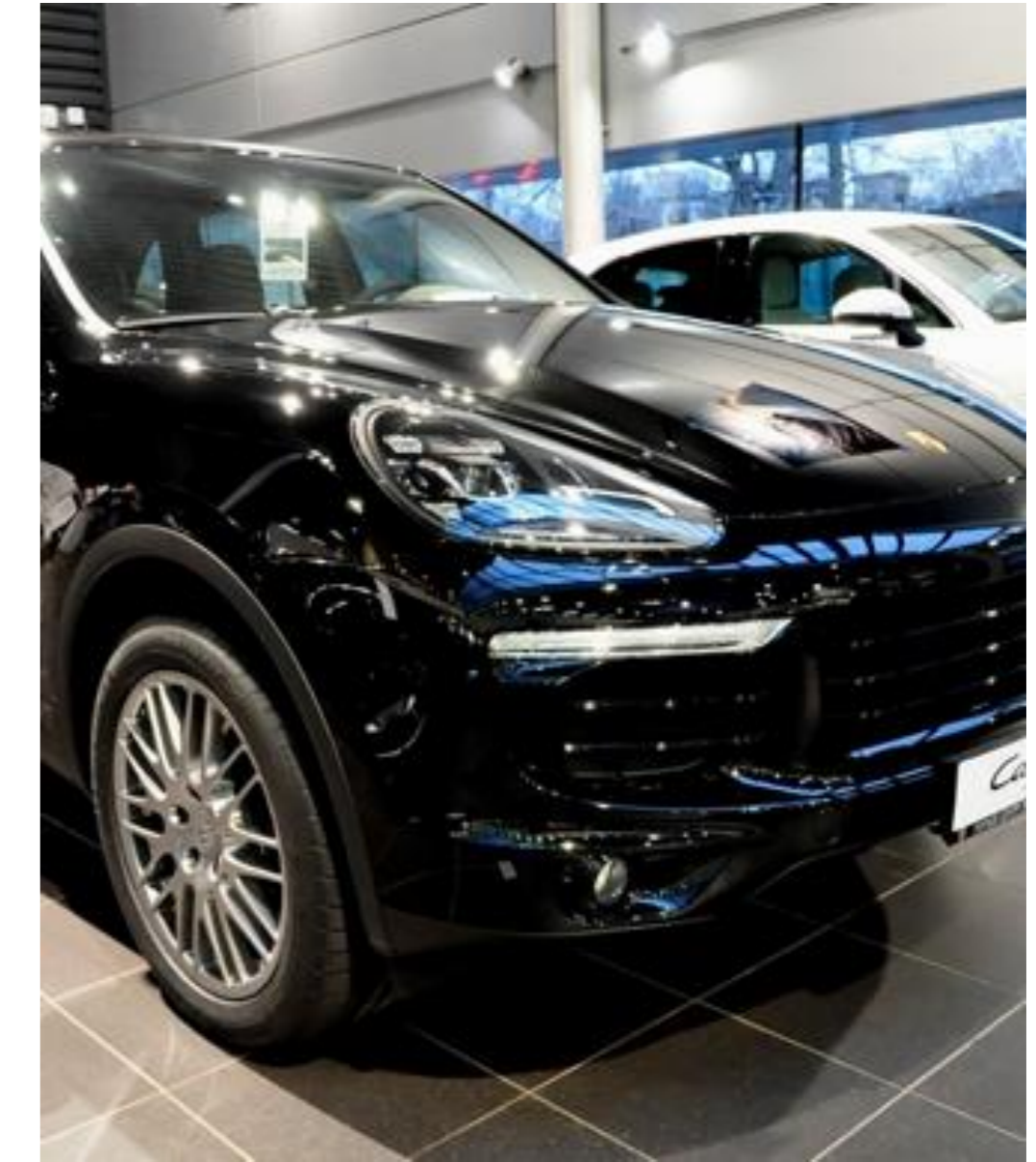
Porsche Cayene, 2017 год